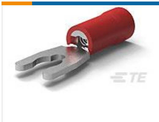
TE 产品编号52949-2 PG SPR SPD 22-16COMM 22-18MIL6