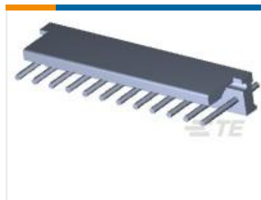
TE 产品编号4-641209-2 12P MTA156 HDR ASSY FL ST LF