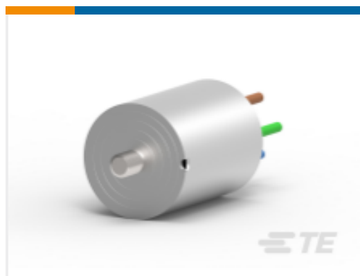
TE 产品编号7-6609089-8 16WGC3=F8248B