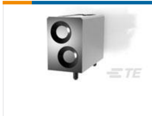
TE 产品编号1469374-1 ATCA GUIDE RIGHT ANGLE FEMALE