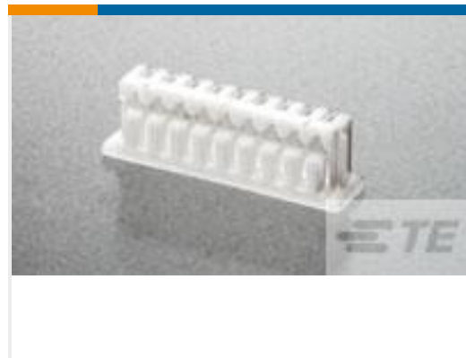
TE 产品编号440146-2 1.25mm WTB Socket,Housing,2p