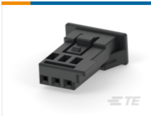
TE 产品编号1-929089-1 3POS MOS FFC REC COD A