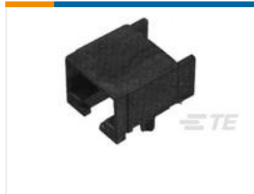
TE 产品编号1116504-2 MJ,10MM,8P,NO SHIELD,SN TAILS