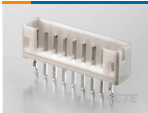
TE 产品编号1470224-3 AMP HPI 2.5 mm Headers