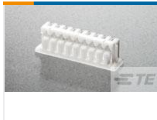
TE 产品编号440146-3 1.25mm WTB Socket,Housing,3p