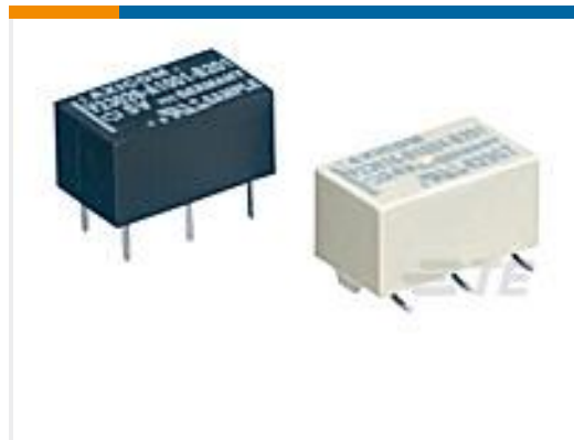
TE 产品编号1393776-3 V23026D1021B201 *X020