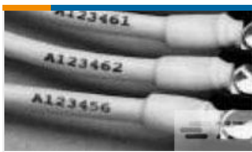
TE 产品编号5052944219 RNF-100-3/32-BK-SP