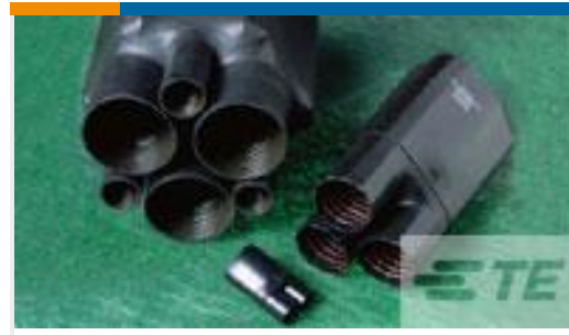
TE 产品编号775717-000 CBR-4-2-A-(B3)