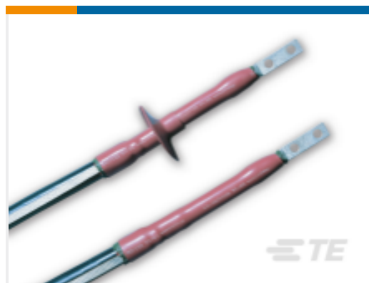
TE 产品编号E32972-000 屏蔽电缆终端