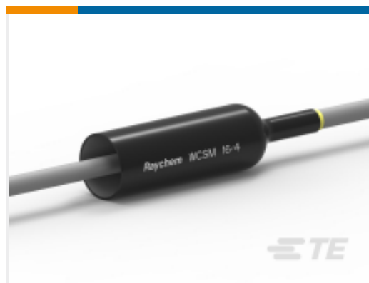
TE 产品编号EE0439-000 WCSM-16/4-1200-S-(B25)