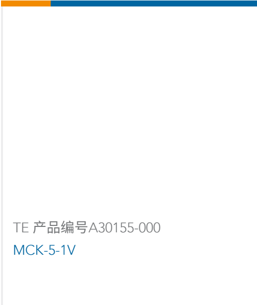
TE 产品编号A30155-000 MCK-5-1V