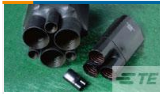
TE 产品编号226877-000 CBR-3-3-A-(B3)