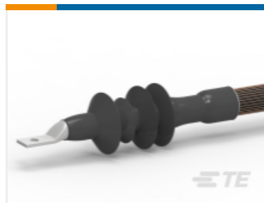
TE 产品编号EH8277-000 CSTO-283G