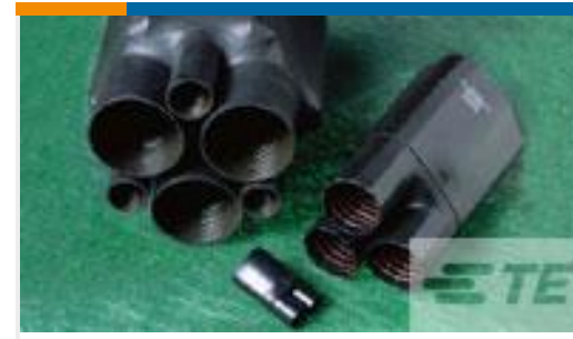
TE 产品编号774741-000 CBR-3-2-A-(B3)