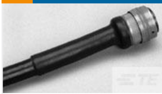
TE 产品编号5190676007 ATUM-12/4-2-30MM