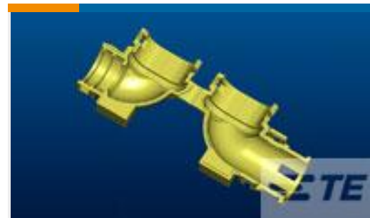
TE 产品编号2141849-1 ADAPTER, CAP, REC HSG 2POS