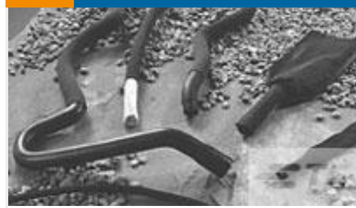
TE 产品编号6203686005 HFT5000-50/25-0-225MM