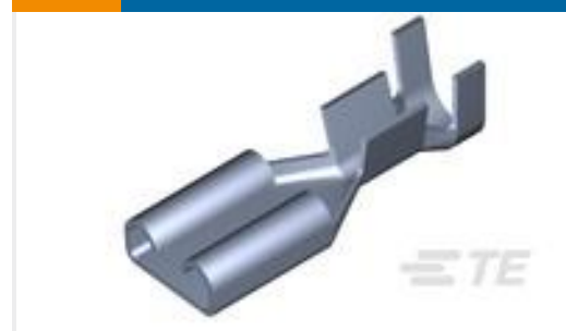
TE 产品编号150681-4 187 FASTON, REC., 20-16 AWG, BR