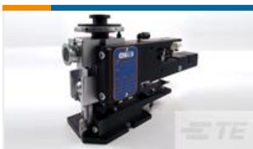
TE 产品编号2150341-2 OCEAN_2.0_Applicator-E-213F288F- REA