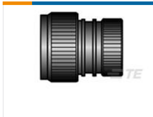
TE 产品编号A97836-000 HEX54-AC-00-15-A5-3