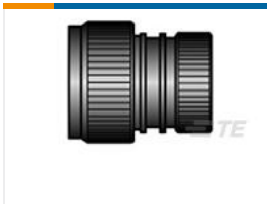
TE 产品编号605407-000 HEX40-AC-00-17-A6-1