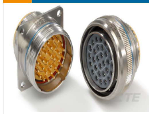
TE 产品编号ZPF00000000202715 983-7SE 12-21 PN