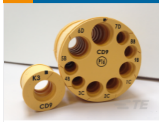
TE 产品编号ZPF00000000101515 054-8020-05