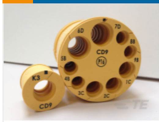
TE 产品编号ZPF00000000100892 054-8005-18