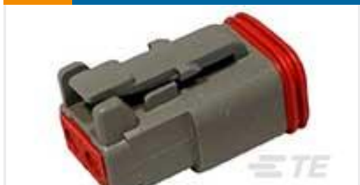
TE 产品编号 DT06-2S PLG, 2P, GRY, N