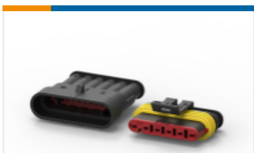
TE 产品编号 282104-1 AMP SUPERSEAL 1.5MM, 连接器壳体