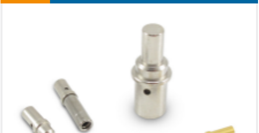
TE 产品编号 0460-202-16141 DEUTSCH Solid Contacts