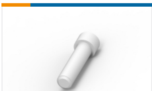
TE 产品编号 114017-ZZ SEALING PLUG, SIZE 12/16, WHT