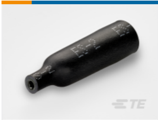
TE 产品编号 CH14360001 ES-CAP-NO.2-B9-X-30MM-FEC