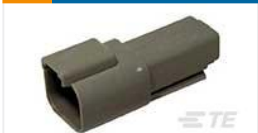
TE 产品编号 DT04-2P REC, 2P, GRY, N