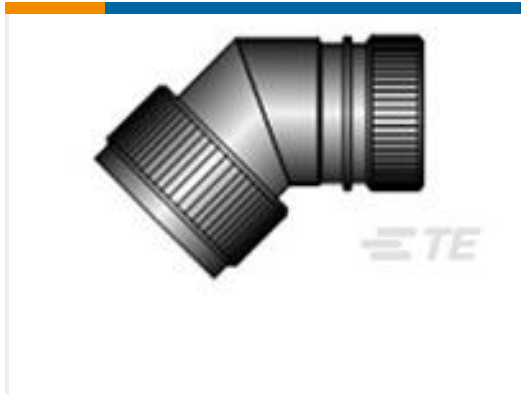
TE 产品编号CZ6862-000 HEX40-AC-45-25-A12-3