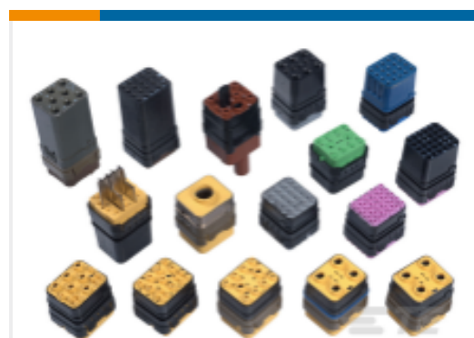
TE 产品编号ZPF000000000203708 DMC-M 99-10 PC