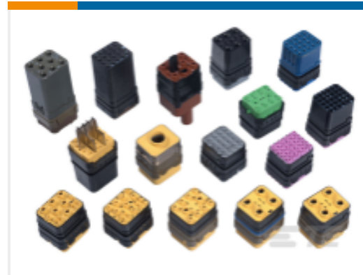
TE 产品编号ZPF000000000202094 DMC-M 0402 AW 01