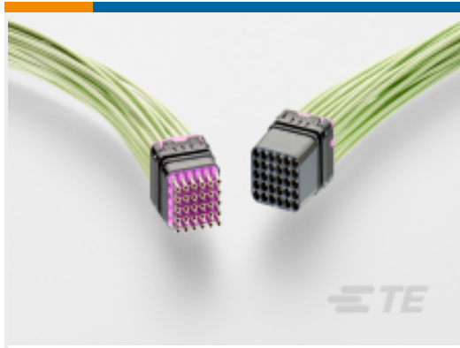
TE 产品编号ZPF000000000203399 DMC-MR 30-23 PD