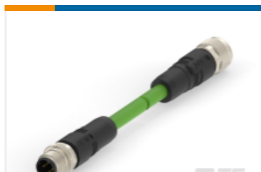
TE 产品编号TAD14541111-002 M12D4-MS-FS-PVC-22SH-TYPE B GREEN-1.0M