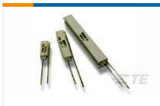
TE 产品编号2-1623730-5 BCHE 4 W 6K8 5%