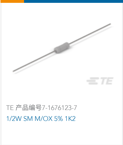
TE 产品编号7-1676123-7 1/2W SM M/OX 5% 1K2