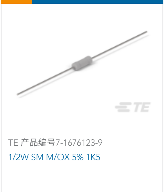
TE 产品编号7-1676123-9 1/2W SM M/OX 5% 1K5