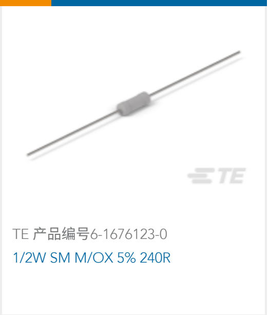
TE 产品编号6-1676123-0 1/2W SM M/OX 5% 240R