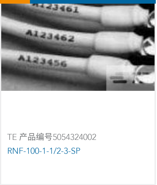
TE 产品编号5054324002 RNF-100-1-1/2-3-SP