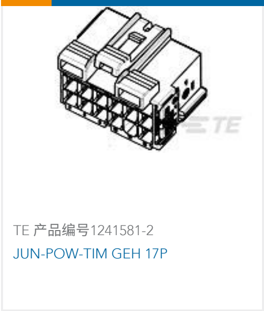
TE 产品编号1241581-2 JUN-POW-TIM GEH 17P