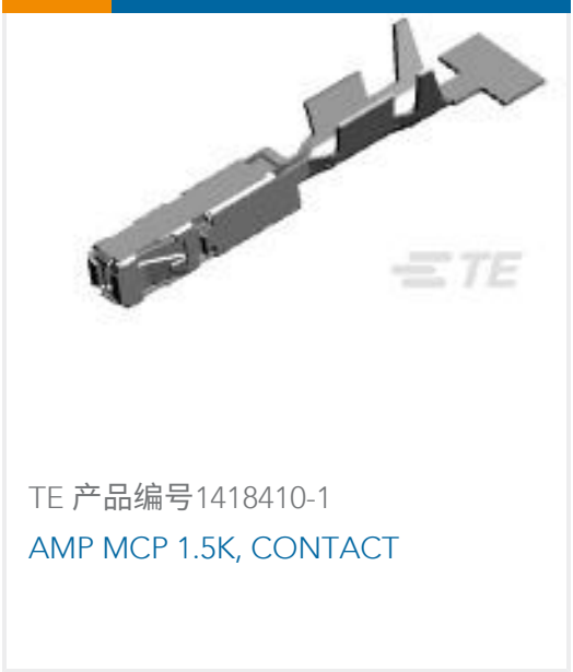
TE 产品编号1418410-1 AMP MCP 1.5K, CONTACT