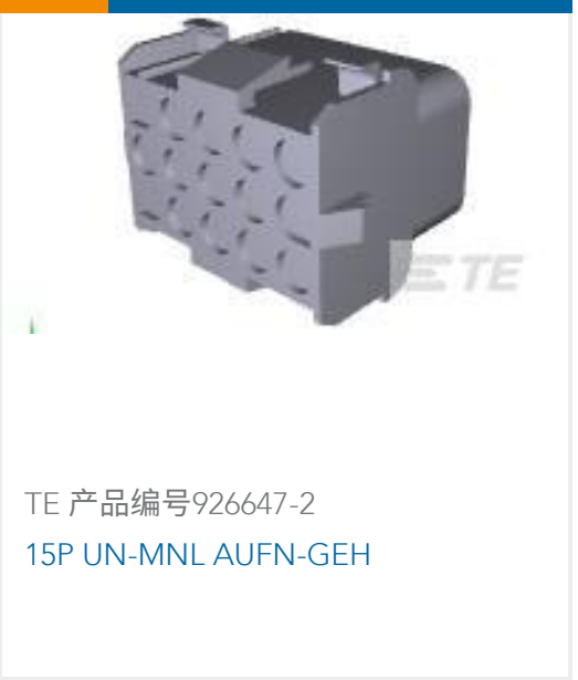
TE 产品编号926647-2 15P UN-MNL AUFN-GEH