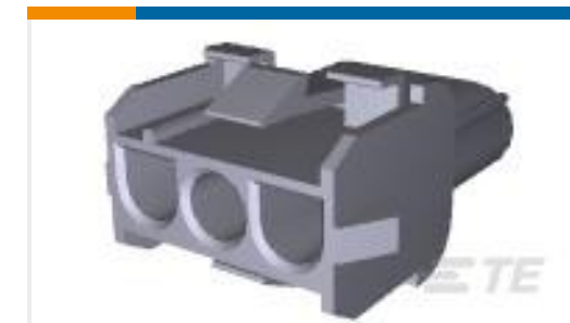
TE 产品编号1-480701-0 03P UMNL CAP HSG NATL