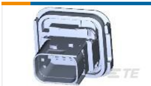
TE 产品编号1-1564416-1 8POS,TAB 1.6X0.6,TAB HSG,ASSY