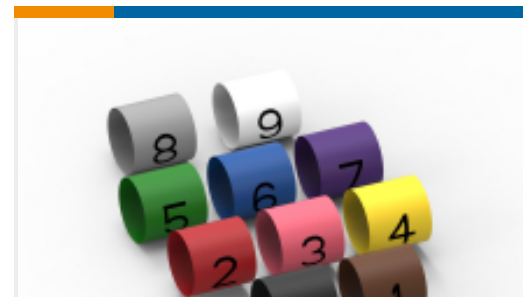
TE 产品编号5059070006 TRSA 热缩管