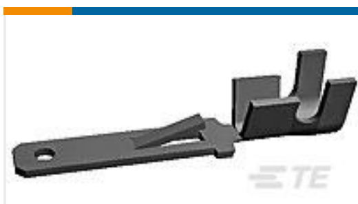
TE 产品编号60294-2 FF 250 TAB 22-18 AWG .032 TPBR