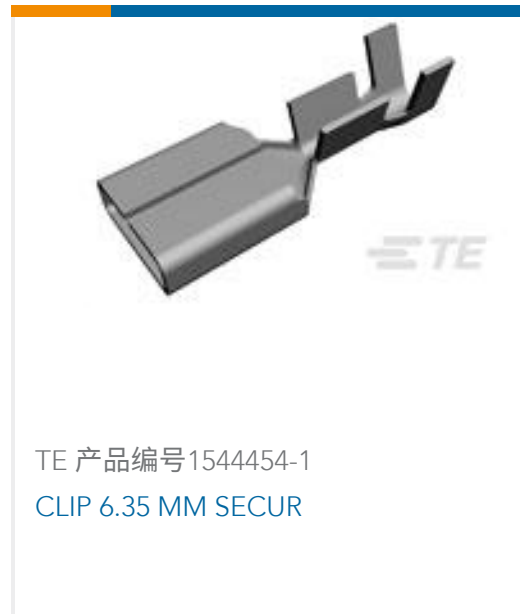
TE 产品编号1544454-1 CLIP 6.35 MM SECUR