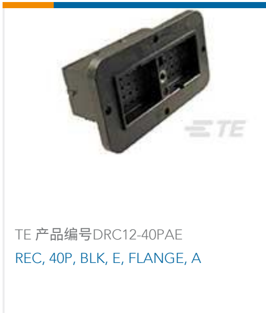
TE 产品编号DRC12-40PAE REC, 40P, BLK, E, FLANGE, A