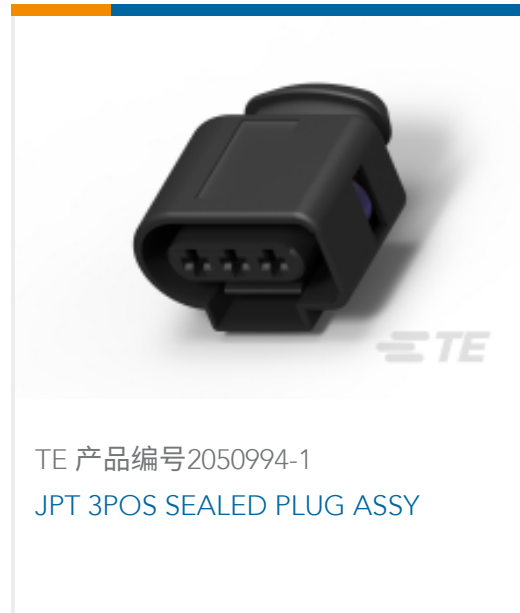
TE 产品编号2050994-1 JPT 3POS SEALED PLUG ASSY