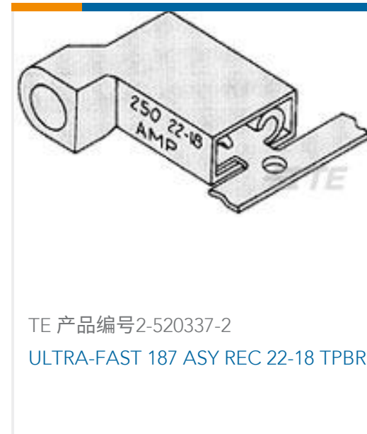
TE 产品编号2-520337-2 ULTRA-FAST 187 ASY REC 22-18 TPBR