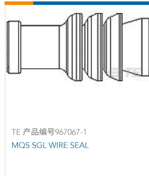
TE 产品编号967067-1 MQS SGL WIRE SEAL