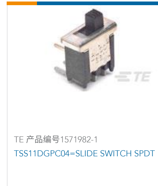
TE 产品编号1571982-1 TSS11DGPC04=SLIDE SWITCH SPDT