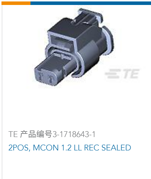
TE 产品编号3-1718643-1 2POS, MCON 1.2 LL REC SEALED