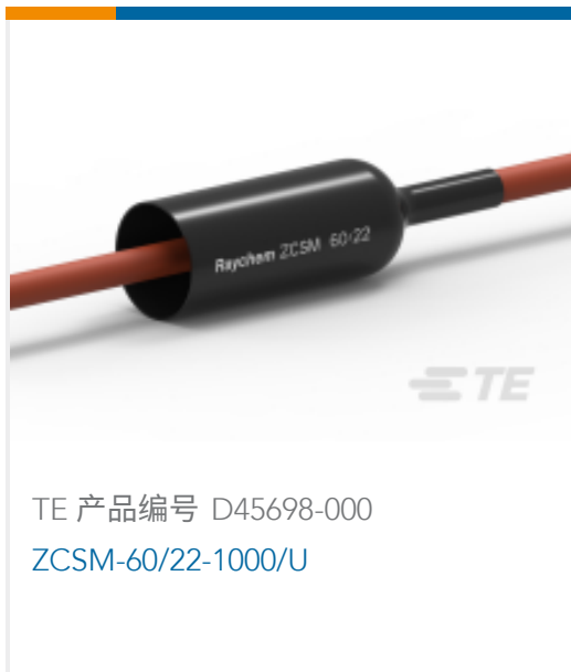
TE 产品编号 D45698-000 ZCSM-60/22-1000/U