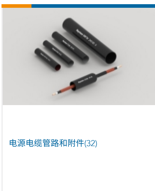
电源电缆管路和附件(32)