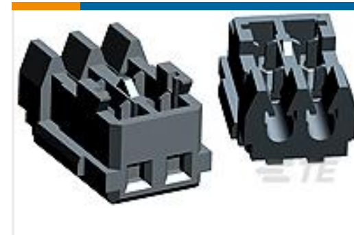
TE 产品编号2-353293-0 MINI CT MT REC ASSY 20P GRAY