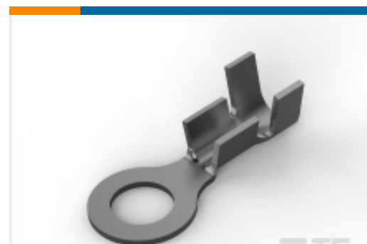
TE 产品编号440456-1 RING TERMINAL, TPBR