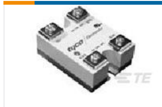
TE 产品编号1393030-4 SSR-240A25= PANEL MOUNT,25A, 240VAC-AC i/p