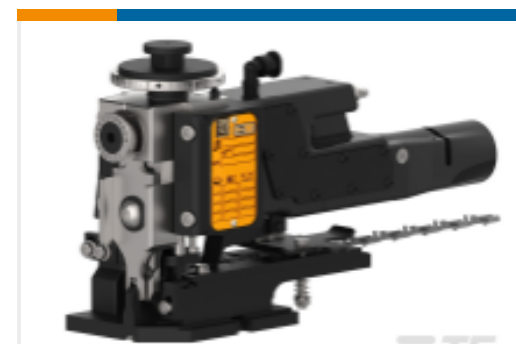
TE 产品编号2150117-2 OCEAN-2.0-APPLICATOR-E-110F-SEA