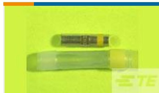
TE 产品编号 650075-000 D-436-37