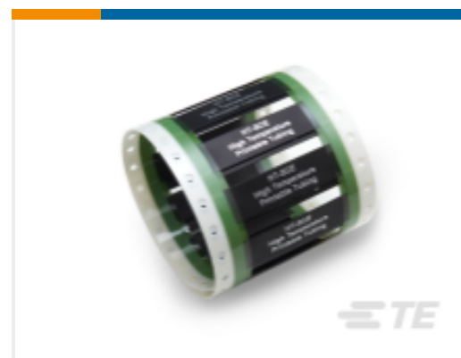
TE 产品编号9410990001 HT-SCE High Temperature Sleeves