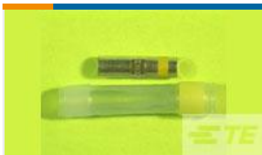
TE 产品编号 650076-000 D-436-38