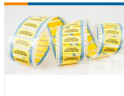
TE 产品编号8350110001 TMS-SCE-1/8-2.0-9