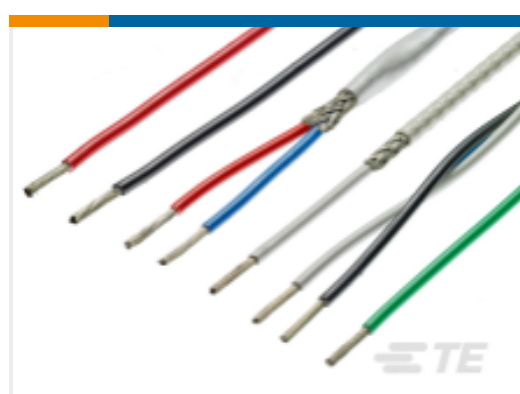
TE 产品编号2611473001 44A0111-12-54