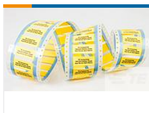
TE 产品编号404545-000 TMS-SCE-1K-3/4-2.0-6