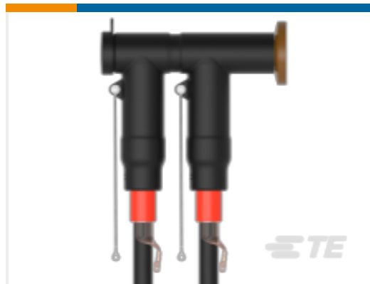
TE 产品编号CR7866-011 RSTI-CC-6853