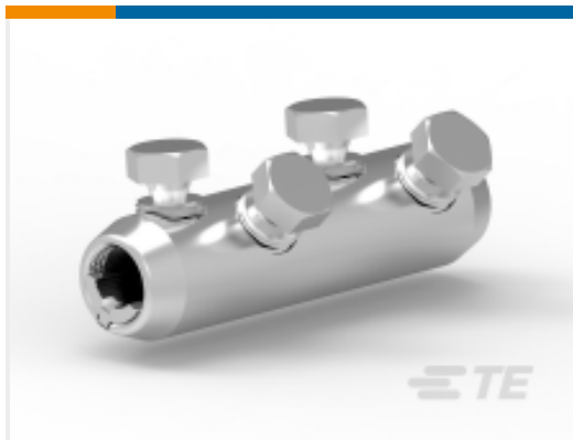
TE 产品编号695012N001 BSM-95/240