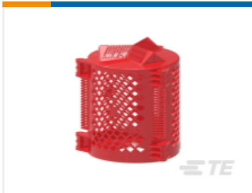
TE 产品编号CR3052-000 变压器的衬套盖