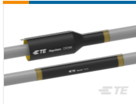
TE 产品编号690469-001 CRSM-198/55-750/S(S1)