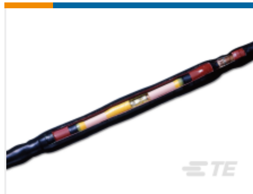
TE 产品编号475941-000 HVS-152-BZ