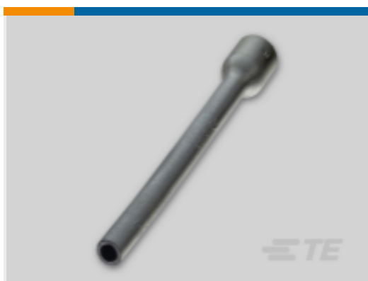
TE 产品编号138518-000 202F274-51-10/164-0