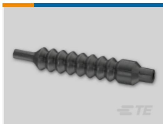
TE 产品编号D20276-000 202G611-780-0