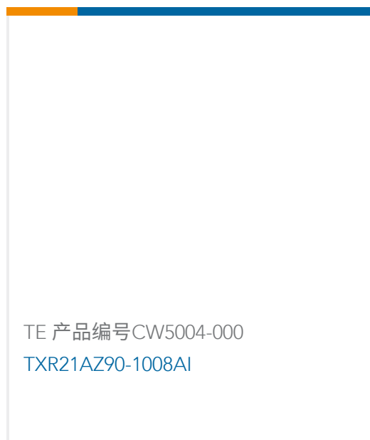
TE 产品编号CW5004-000 TXR21AZ90-1008AI