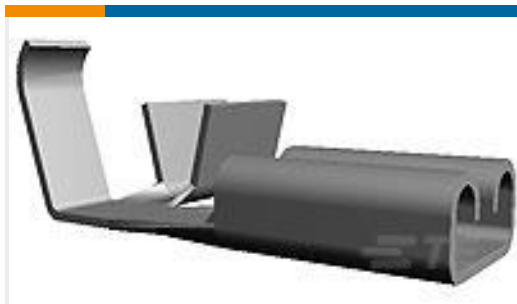
TE 产品编号60605-1 110 FASTON FLAG REC 22-18 AWG TPBR