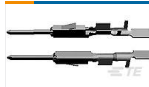
TE 产品编号5-963716-1 MOSQ,63 Sn tab LL unseal. 0,5-0,75