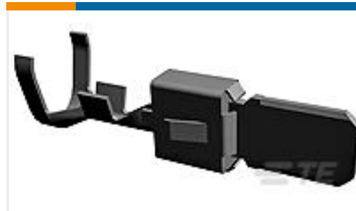
TE 产品编号964310-1 TAB A 5.8x0.8 CONTACT CF SWS Sn