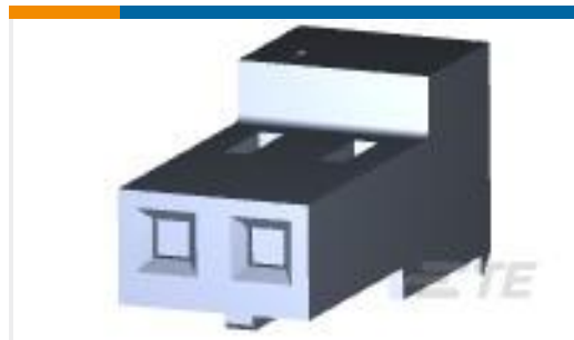
TE 产品编号3-640431-2 02P MTA156 CONN ASSY 18AWG ORA