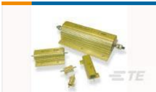
TE 产品编号3-1625963-9 HSA5 5R0 1%