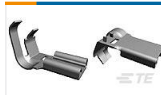
TE 产品编号41531 250 FASTON FLAG REC 18-12 AWG BR