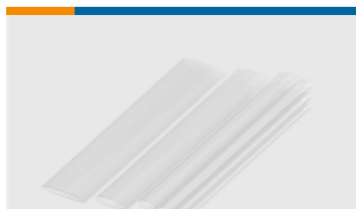
TE 产品编号NB13612001 RNF-100-3/8-CL-STK