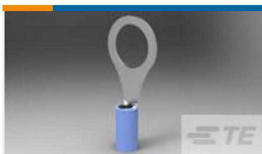
TE 产品编号320564 TERMINAL,PIDG R 16-14 3/8