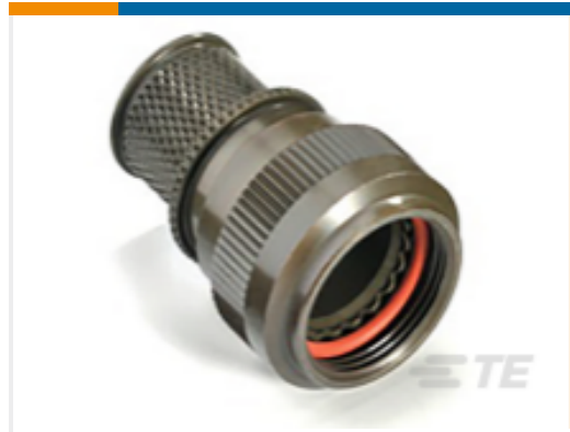
TE 产品编号BTH1-15-08-1-ZN BTH1-15-08-1-ZN