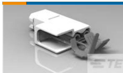
TE 产品编号521599-2 ULTRA-POD 187 ASY REC 18-14 TPBR