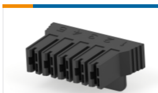
TE 产品编号1969897-1 250 FASTON HSG.,REC.,5 POS,BLACK