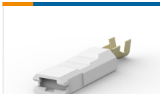
TE 产品编号1-1969529-1 ULTRA-POD 250 ASSEMBLY REC 18- 14 AWG BR