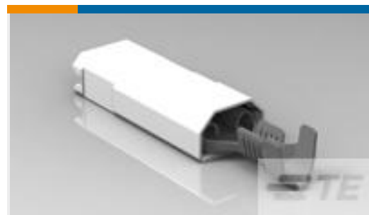
TE 产品编号521367-2 ULTRA-POD 250 ASSY REC 18-14 AWG TPBR