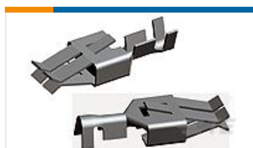
TE 产品编号964202-1 STD TIMER CONTACT