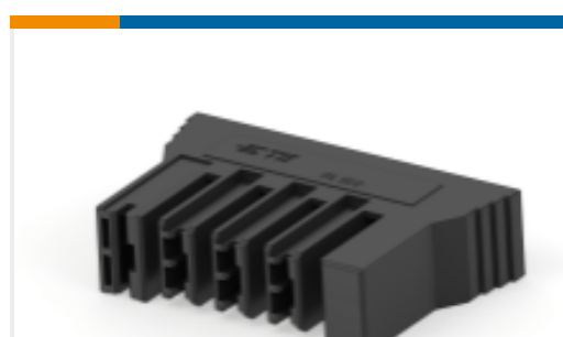
TE 产品编号1969898-1 250 & 187 FASTON HSG.,REC.,4 POS, BLACK