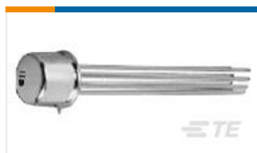
TE 产品编号5-1617351-1 JMSPD-26XP=M39016/16-028P