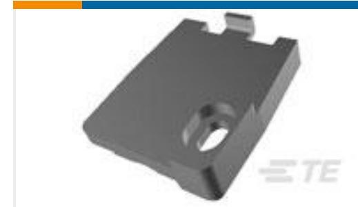
TE 产品编号640714-1 03P UMNL STR/REL