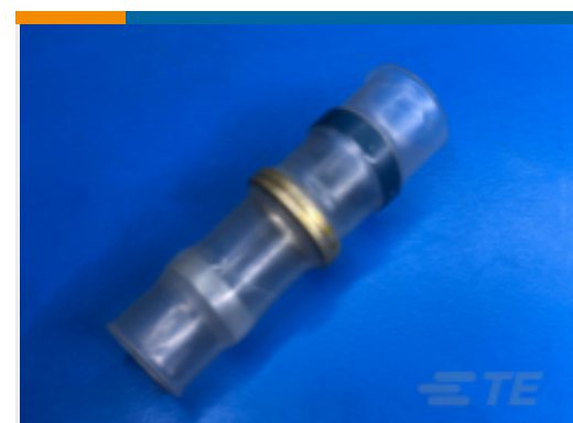
TE 产品编号D18609-000 B-155-07-F