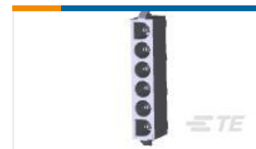
TE 产品编号641832-1 06P UMNL PIN HDR ASSY V2 NATL