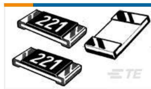
TE 产品编号3-2176230-2 3522 330R 5% 3W