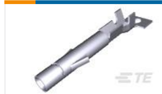
TE 产品编号926895-1 UNIVERSAL M-N-L SOCKET