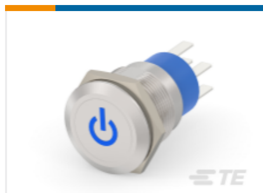
TE 产品编号5-2213766-9 AV19 DPM 5A POWER LED BLUE 24V