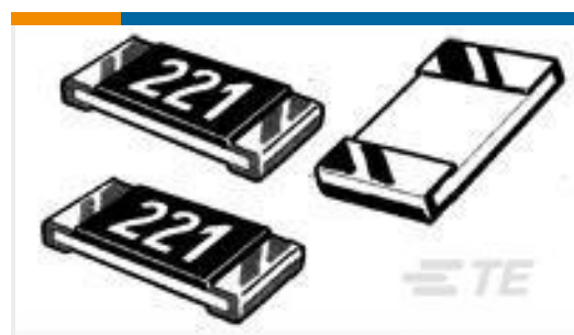
TE 产品编号2-2176070-9 3521 150R 1% 2W