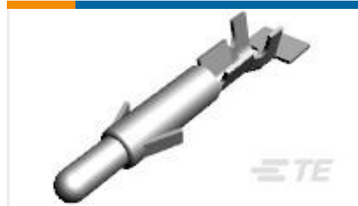
TE 产品编号926896-1 UNIV.M-N-L.PIN