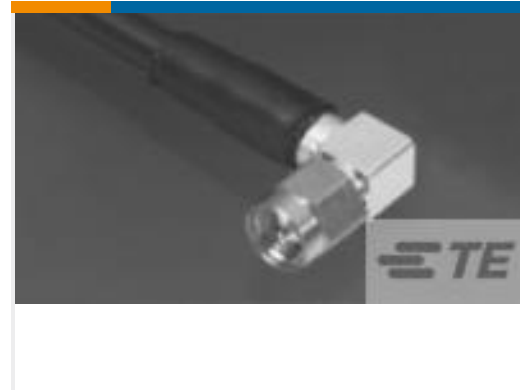
TE 产品编号1052203-1 2037 8126 92