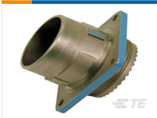
TE 产品编号YDIV46E25-61SNC128 PLUG ASSY