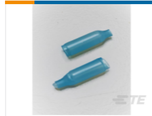
TE 产品编号039695-000 CTA-0013