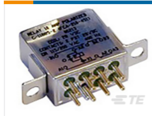
TE 产品编号1-1617749-5 FCA-210-1020M=M83536/10-020M