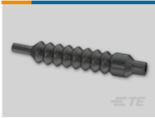
TE 产品编号F67100-000 202C653-770-0