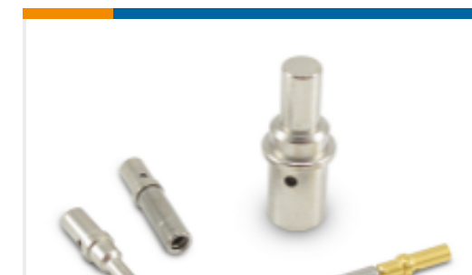
TE 产品编号0462-209-16141 DEUTSCH Solid Contacts