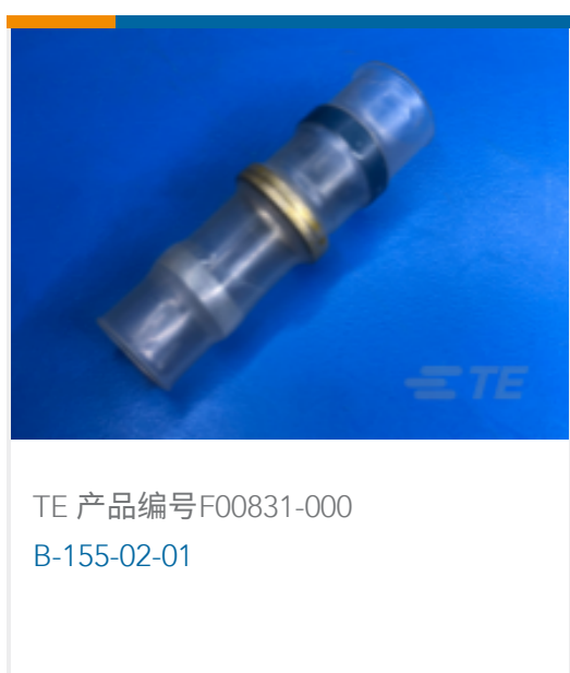
TE 产品编号F00831-000 B-155-02-01