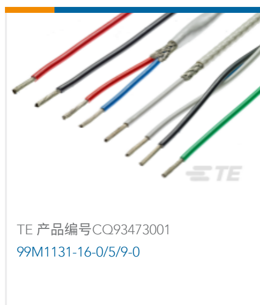
TE 产品编号CQ93473001 99M1131-16-0/5/9-0