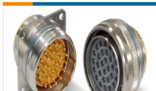
TE 产品编号ZPF000000000039055 983-7S 16-24 PN-L