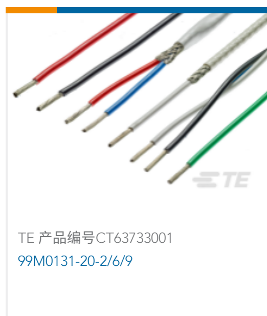
TE 产品编号CT63733001 99M0131-20-2/6/9