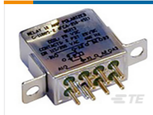
TE 产品编号1-1617749-5 FCA-210-1020M=M83536/10-020M