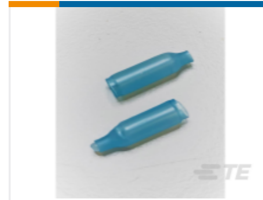
TE 产品编号039695-000 CTA-0013