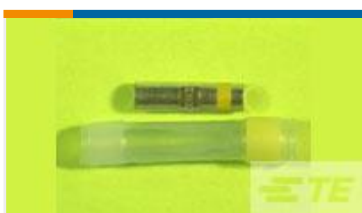
TE 产品编号 650075-000 D-436-37