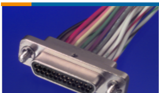
TE 产品编号3-1532171-0 M83513/04-A14C, MCKS-C2-B-9S6G9-72.0