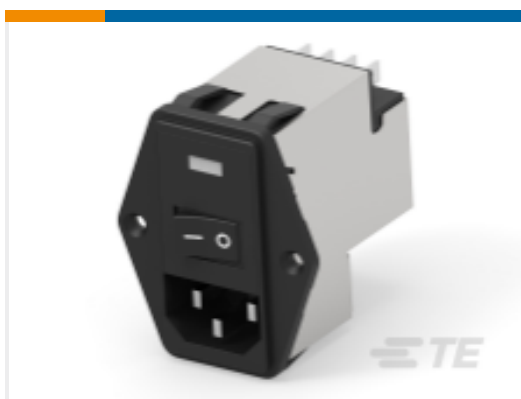
TE 产品编号3-6609929-8 PE0SXSS6B=C2252