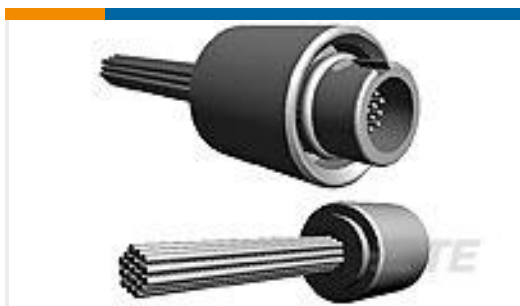
TE 产品编号1-1589064-3 TCM019PC2DM036 = CIRCULAR