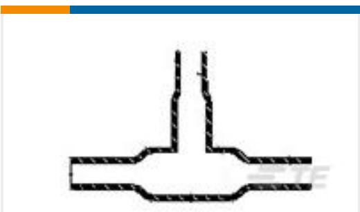
TE 产品编号C89841-000 322A412-100-00/180-0