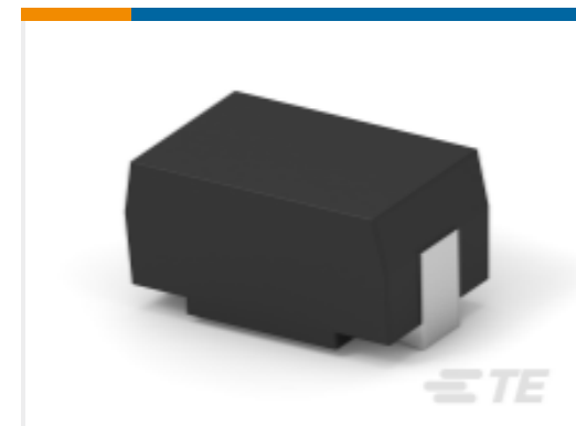
TE 产品编号1-1879022-5 SMD 功率电阻器：7 瓦特，200-2M 欧姆