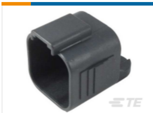
TE 产品编号1011-347-0605 DUST CAP, 6P, PLG, BLK, DT