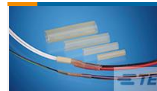
TE 产品编号CH09346001 DSPL-NR3-X-40MM