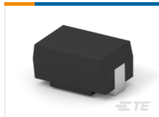
TE 产品编号7-1879021-3 SMD 功率电阻器：7 瓦特，.10-500 欧姆