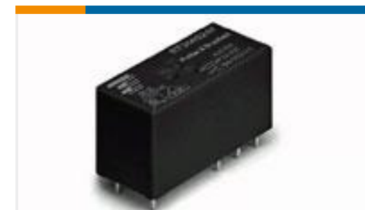
TE 产品编号2-1419108-8 RTD14005F