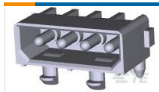
TE 产品编号1-641737-1 04P CMNL HDR ASSY R/A V0