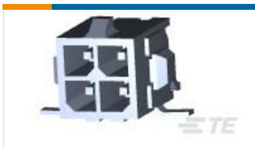
TE 产品编号3-794629-4 04P MICRO MNL ASSY,R/A,SMT,LF