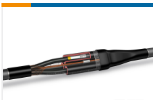
TE 产品编号A69078-064 POLJ-12/3X70-150