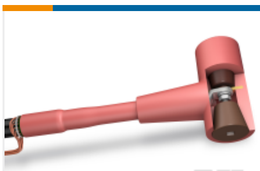
TE 产品编号555340-070 RICS-5123