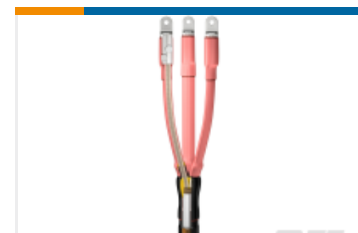
TE 产品编号A31452-070 GUST-12/70-120/800-L12