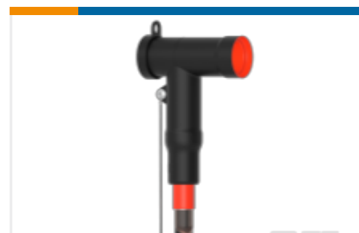
TE 产品编号CM0012-072 屏蔽式可分离连接器 1250 A