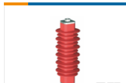
TE 产品编号EN6028-000 HDA-33M-B3-NFF