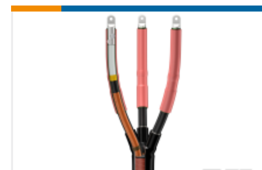
TE 产品编号E92435-063 POLT-12D/3XIH1