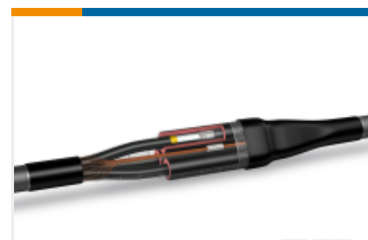
TE 产品编号D11309-070 POLJ-12/3X25-70