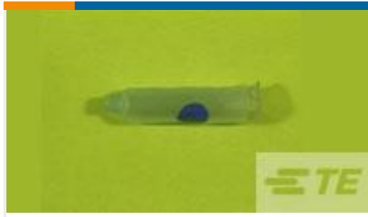
TE 产品编号617867-000 D-436-0186