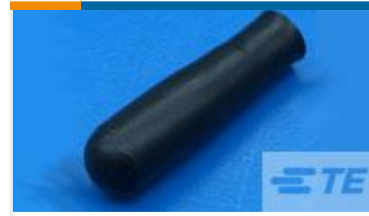
TE 产品编号610015-000 D-300-02