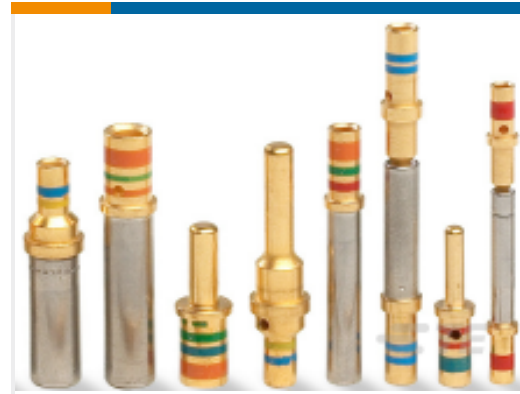
TE 产品编号2562-209-2031 CONT SOC ASSY