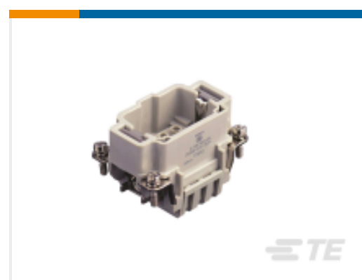
TE 产品编号T2040064101-000 HE-006-MC