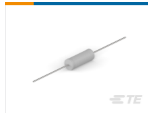
TE 产品编号7-2176412-7 5W XSM M/OX 5% 7K5