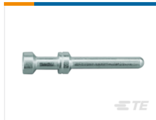
TE 产品编号T2030001015-000 CEM-1.5