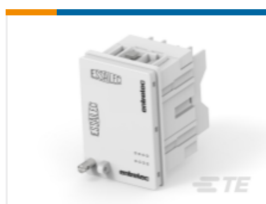
TE 产品编号1SNA166627R2200 TC-E-VA-2-2