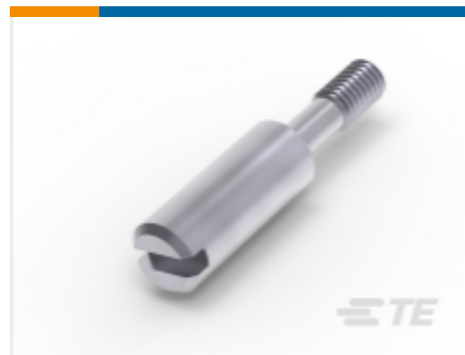
TE 产品编号T0931003003-000 CODING-PIN-M3