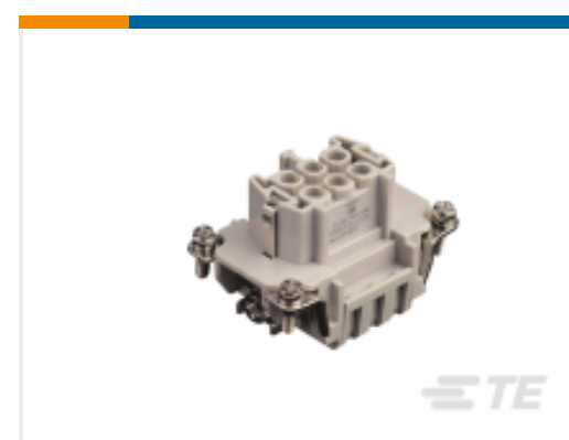
TE 产品编号T2040064201-000 HE-006-FC