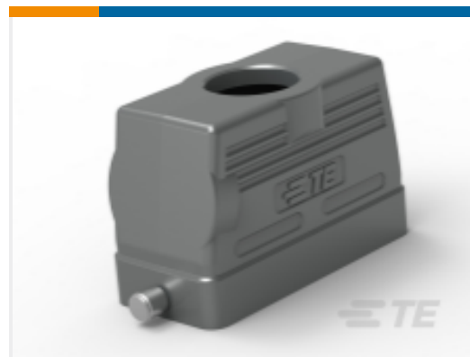
TE 产品编号T1320160121-000 H16B-TG-RO-PG21