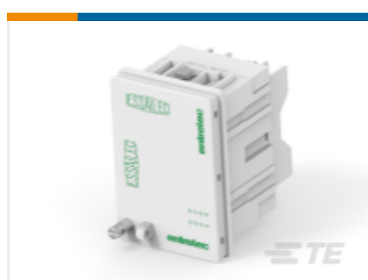
TE 产品编号1SNA166625R2000 CC-E-VA-6.6