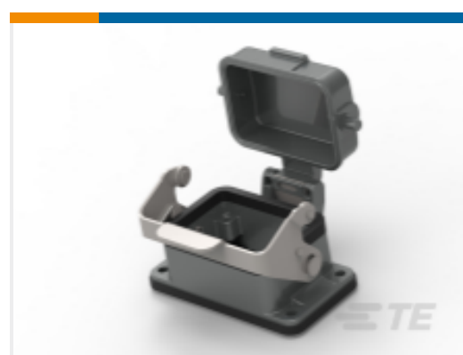
TE 产品编号T1510062000-000 H6B-ADMS