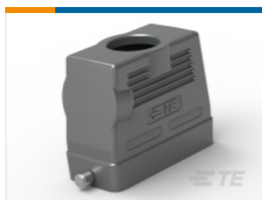
TE 产品编号T1340160129-000 H16B-TGH-RO-PG29