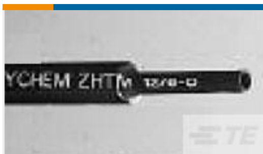
TE 产品编号2411034003 ZHTM-3/1.5-0-SP