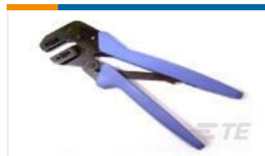
TE 产品编号58630-1 PROCRIMP HT&D 12-10 ULTRAFast