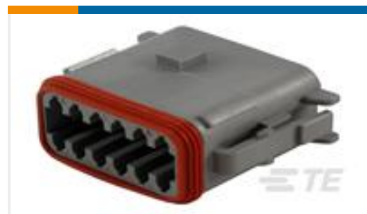
TE 产品编号DT06-12SA-B016 PLG, 12P, GRY, N, ENH KEY, A