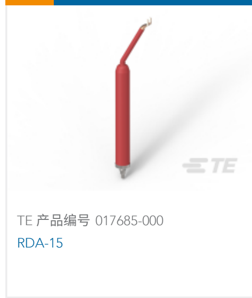
TE 产品编号 017685-000 RDA-15