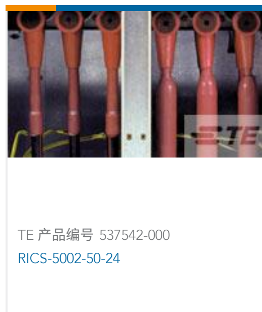
TE 产品编号 537542-000 RICS-5002-50-24