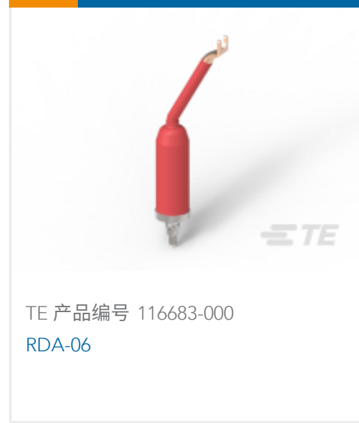
TE 产品编号 116683-000 RDA-06