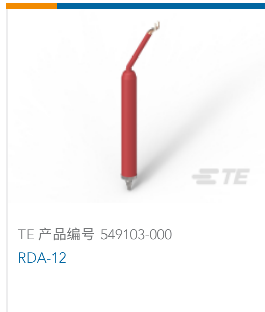
TE 产品编号 549103-000 RDA-12