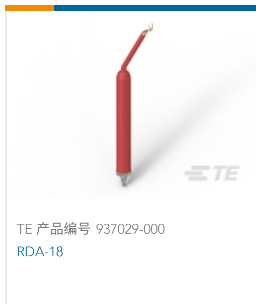
TE 产品编号 937029-000 RDA-18