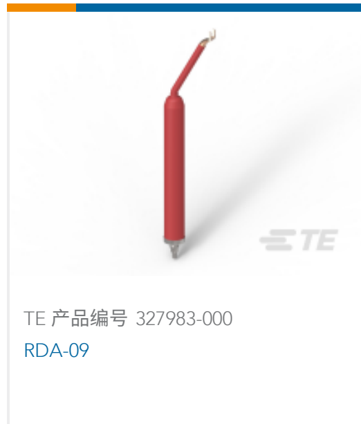
TE 产品编号 327983-000 RDA-09