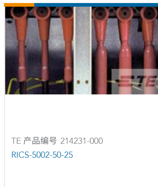
TE 产品编号 214231-000 RICS-5002-50-25