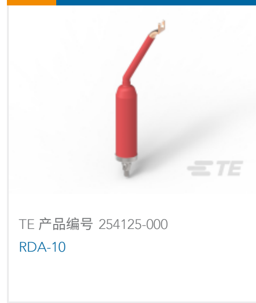
TE 产品编号 254125-000 RDA-10