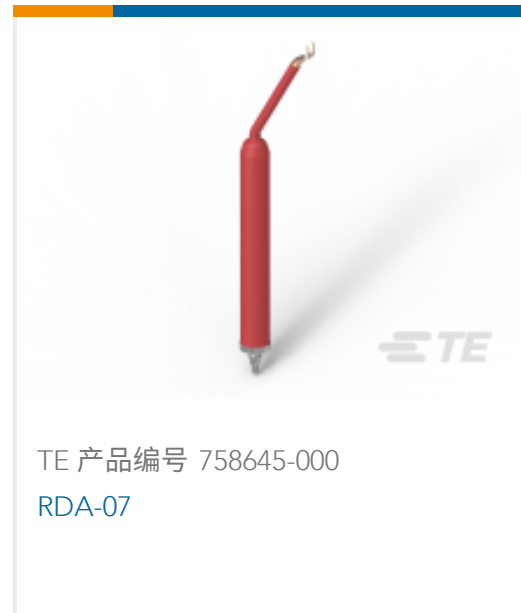
TE 产品编号 758645-000 RDA-07