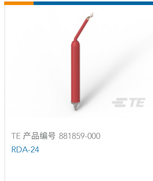
TE 产品编号 881859-000 RDA-24