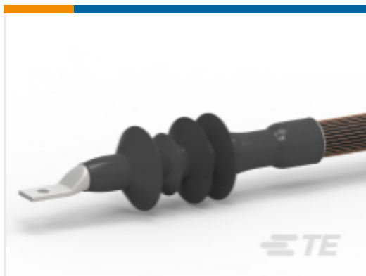
TE 产品编号EH7832-000 CSTO-283J