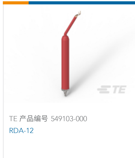
TE 产品编号 549103-000 RDA-12