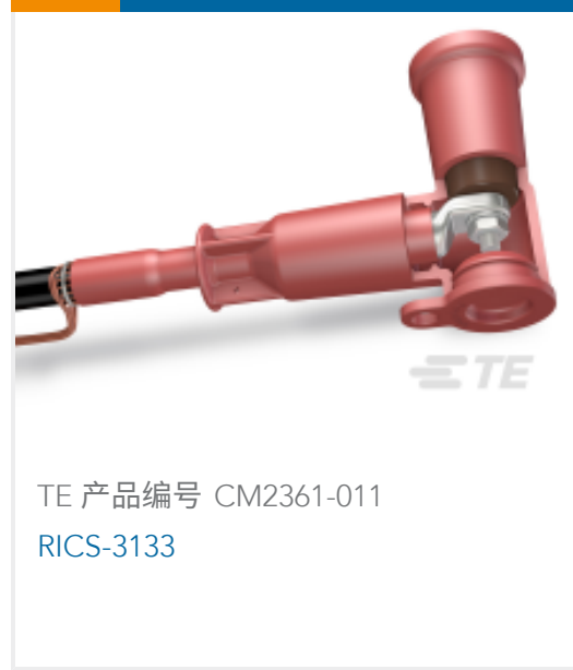
TE 产品编号 CM2361-011 RICS-3133