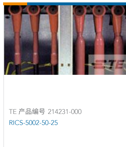
TE 产品编号 214231-000 RICS-5002-50-25