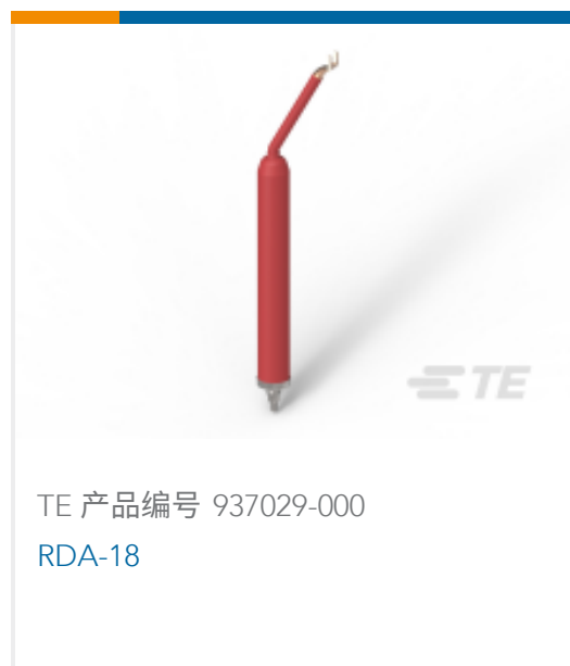
TE 产品编号 937029-000 RDA-18