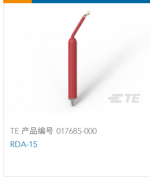
TE 产品编号 017685-000 RDA-15