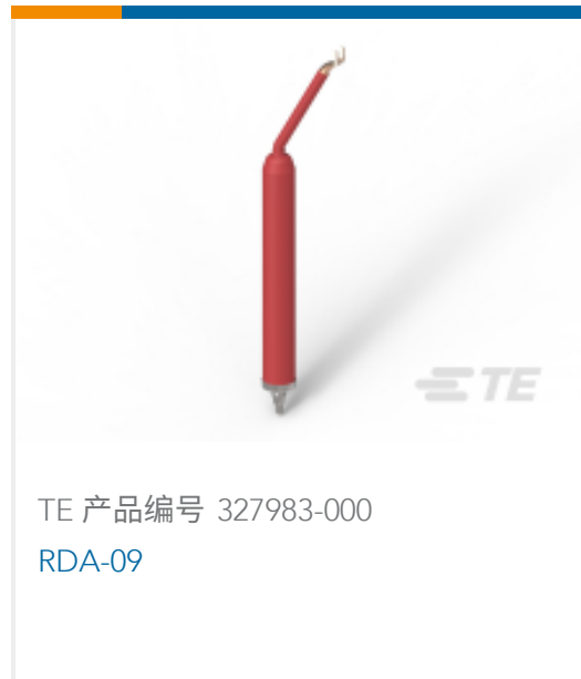
TE 产品编号 327983-000 RDA-09