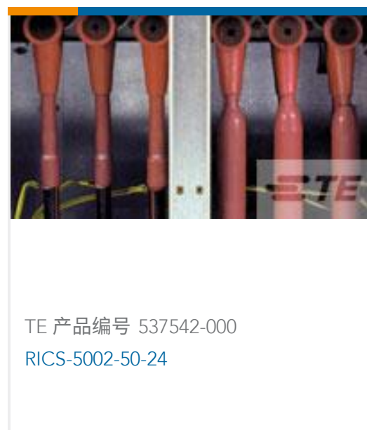
TE 产品编号 537542-000 RICS-5002-50-24