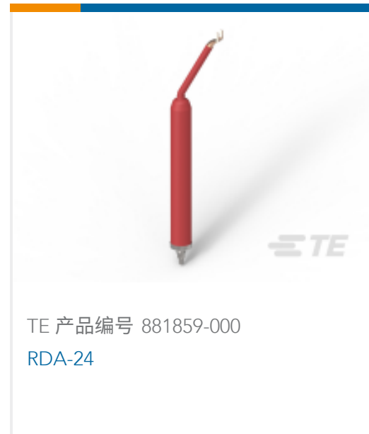
TE 产品编号 881859-000 RDA-24