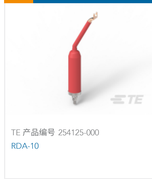
TE 产品编号 254125-000 RDA-10