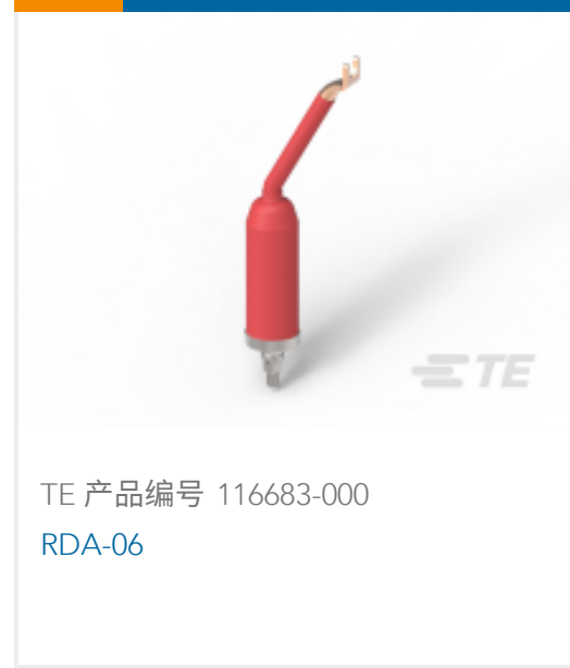
TE 产品编号 116683-000 RDA-06