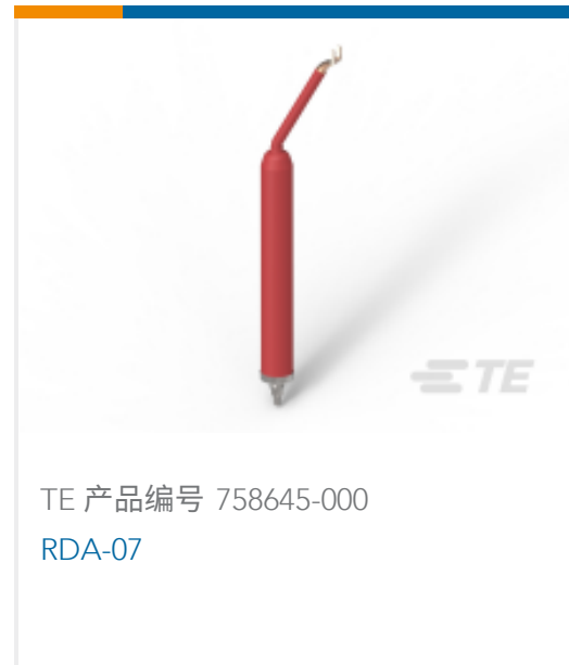
TE 产品编号 758645-000 RDA-07