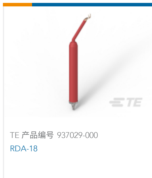
TE 产品编号 937029-000 RDA-18