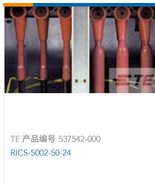
TE 产品编号 537542-000 RICS-5002-50-24