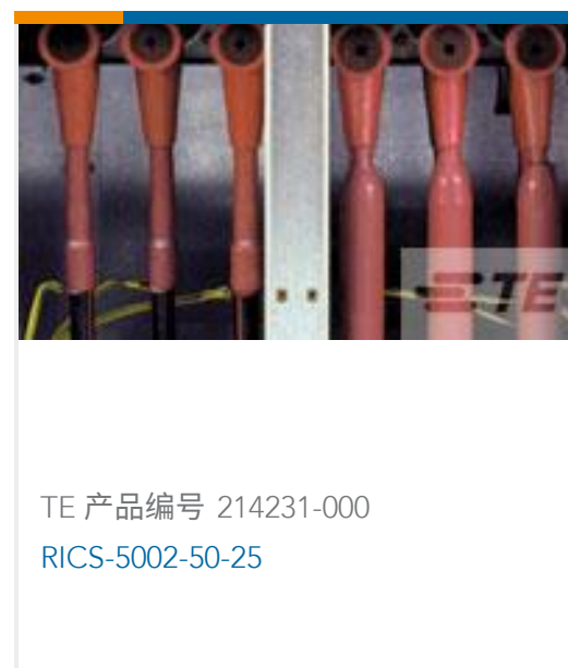
TE 产品编号 214231-000 RICS-5002-50-25