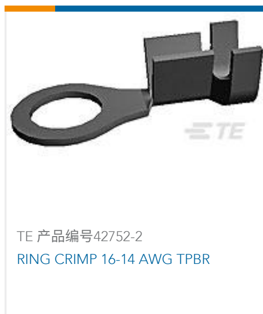
TE 产品编号 42752-2 RING CRIMP 16-14 AWG TPBR