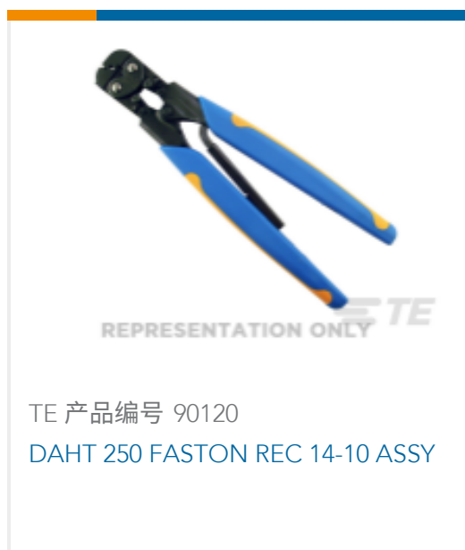
TE 产品编号 90120 DAHT 250 FASTON REC 14-10 ASSY