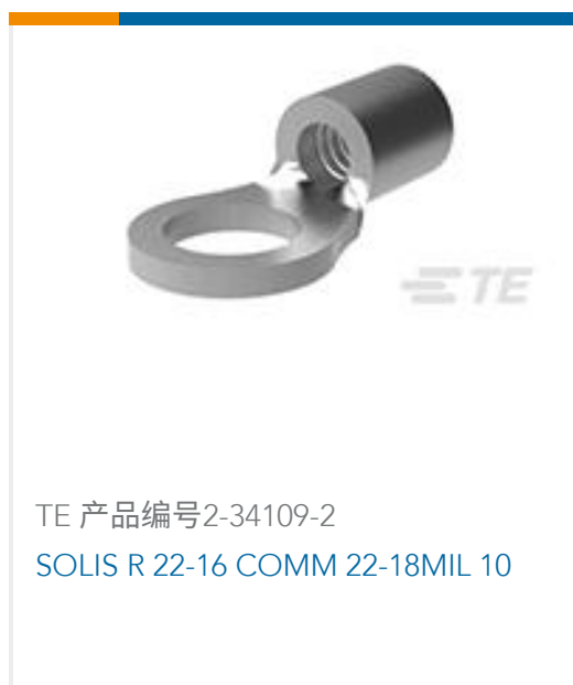
TE 产品编号 2-34109-2 SOLIS R 22-16 COMM 22-18MIL 10