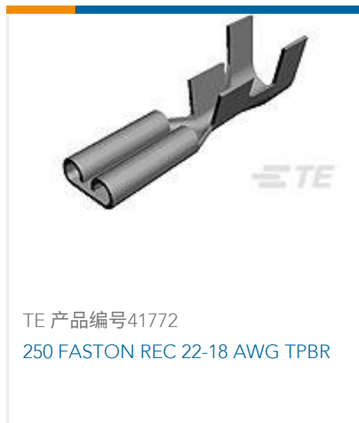
TE 产品编号 41772 250 FASTON REC 22-18 AWG TPBR