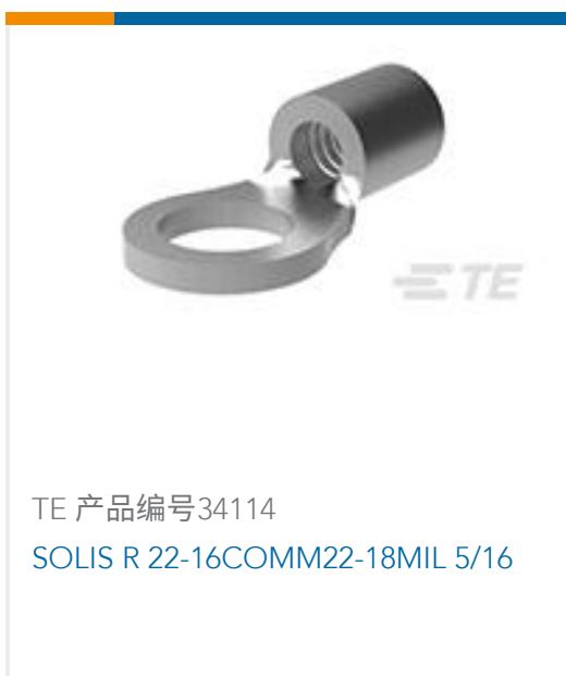
TE 产品编号 34114 SOLIS R 22-16COMM22-18MIL 5/16