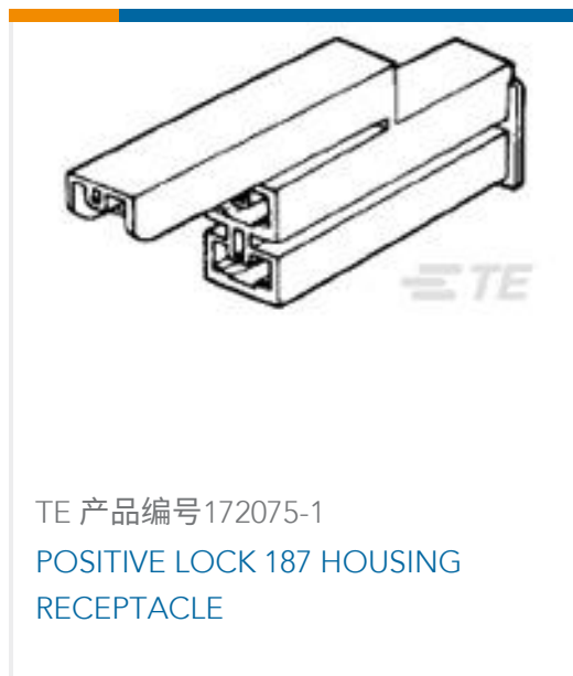
TE 产品编号 172075-1 POSITIVE LOCK 187 HOUSING RECEPTACLE