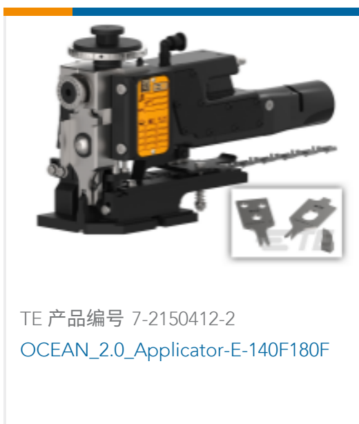
TE 产品编号 7-2150412-2 OCEAN_2.0_Applicator-E-140F180F