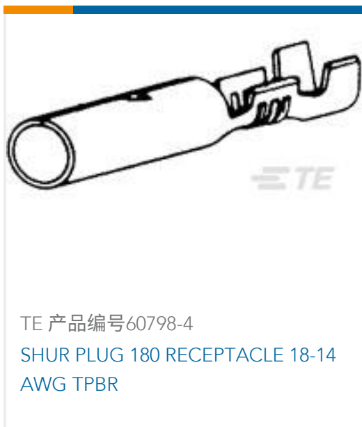
TE 产品编号 60798-4 SHUR PLUG 180 RECEPTACLE 18-14 AWG TPBR