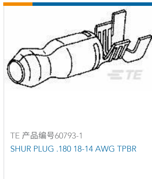
TE 产品编号 60793-1 SHUR PLUG .180 18-14 AWG TPBR