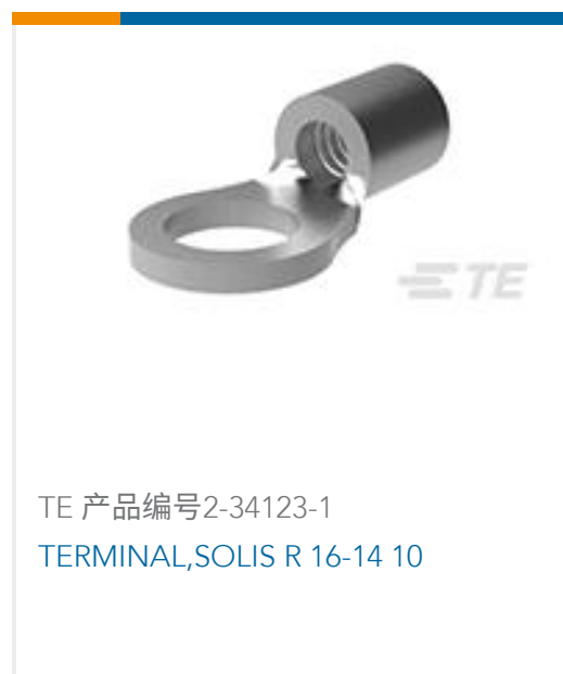
TE 产品编号 2-34123-1 TERMINAL,SOLIS R 16-14 10