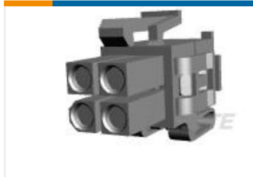
TE 产品编号1586617-1 04p mini umnl plug hsg spcl