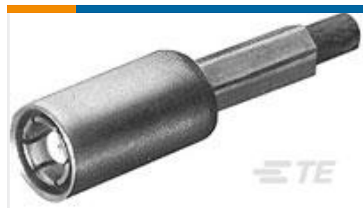
TE 产品编号413985-3 PLUG ASSY,STR,SMB