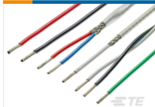
TE 产品编号287095-000 44A0112-16-8