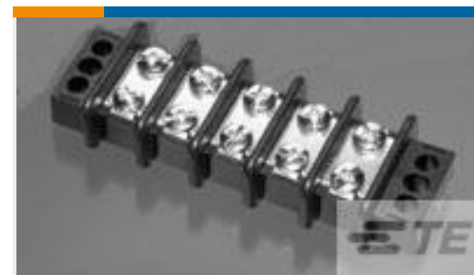
TE 产品编号1546311-6 6P .563" DR BARRIER,W/WASHER