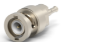
TE 产品编号 5330876 BNC PLUG