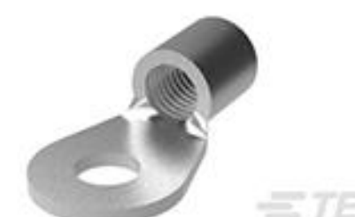
TE 产品编号 33461 TERMINAL, SOLIS R 8 1/4