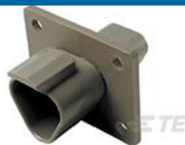
TE 产品编号 DT04-3P-L012 REC, 3P, GRY, N, FLANGE