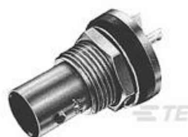
TE 产品编号 5227426-1 BNC BLKHD RECPT SEALED