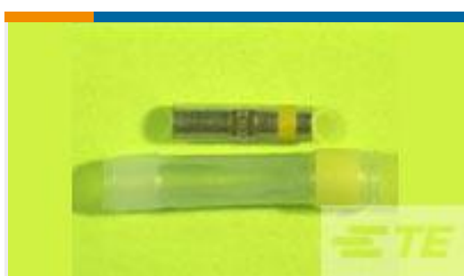
TE 产品编号 650076-000 D-436-38