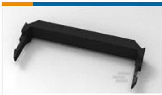
TE 产品编号1-499252-3 064 STRAIN RELIEF A-L RCPT