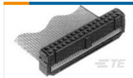
TE 产品编号1658622-8 34 NOVO MIL/CTR 30DP, LEAD FREE