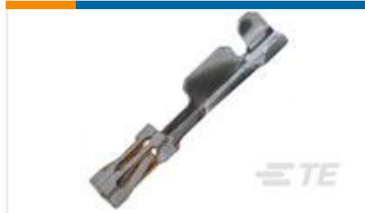
TE 产品编号6-87523-9 MOD IV RECP LP LF