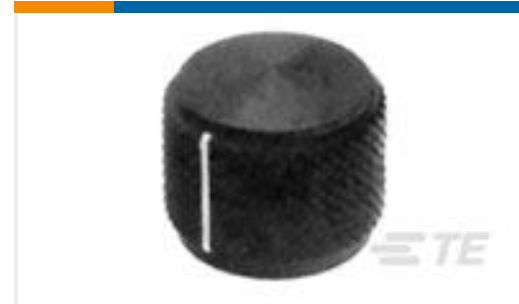
TE 产品编号7-1437621-2 KD500B1/4=KNOB BLK DIAMOND KNU