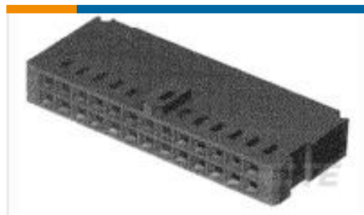
TE 产品编号102387-4 20 MODIV HSG COMP DR .100 POL