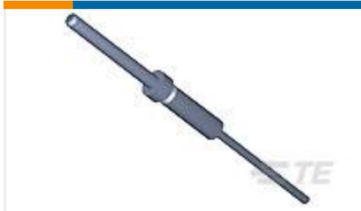
TE 产品编号207683-8 AMPLIMITE, PIN CONT, SZ 22D