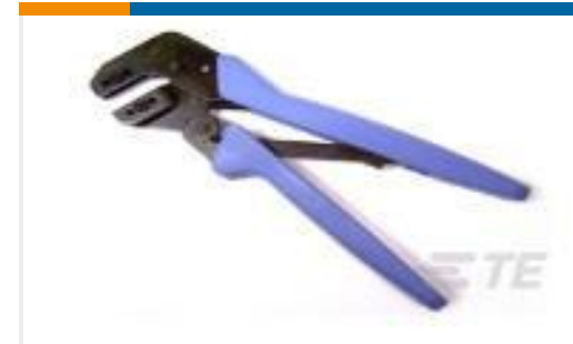
TE 产品编号90546-1 ASSY PRO-CRIMPER UNIV M-N-L