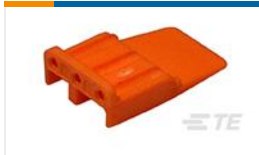
TE 产品编号WM-3S WEDGE LOCK, 3P, PLG, ORG, DTM