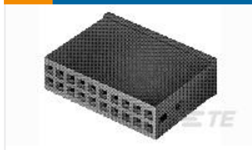
TE 产品编号925369-4 MOD IV HSG