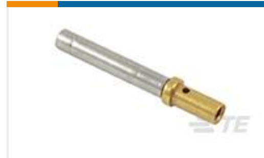
TE 产品编号0462-201-2031 SOC, SOLID, SIZE 20, 20AWG, AU