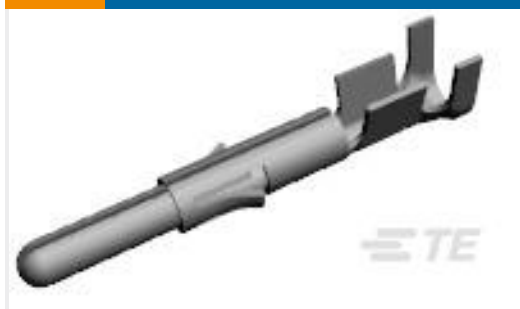
TE 产品编号350669-1 UMNL GRND PIN 20-14 PTPBR L/P