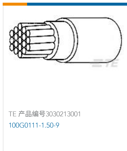
TE 产品编号3030213001 100G0111-1.50-9