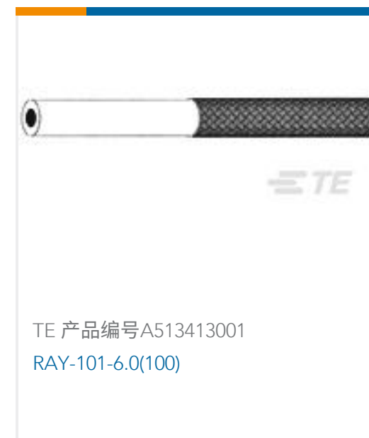
TE 产品编号A513413001 RAY-101-6.0(100)