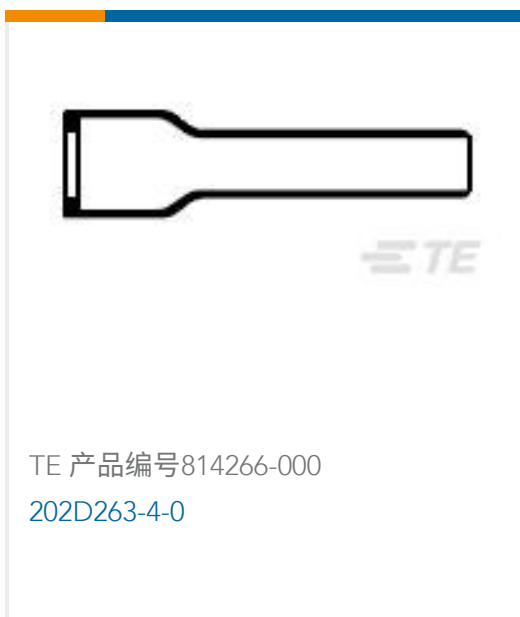
TE 产品编号814266-000 202D263-4-0