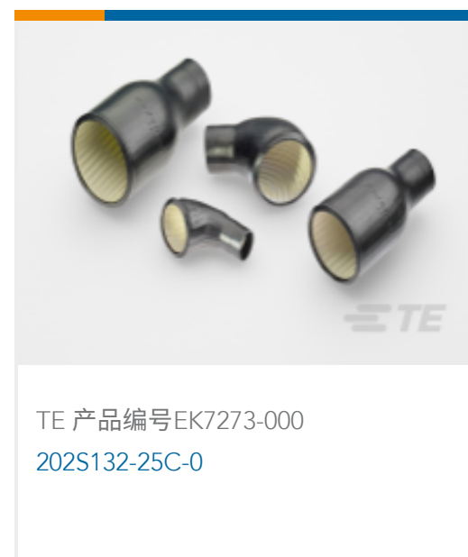
TE 产品编号EK7273-000 202S132-25C-0