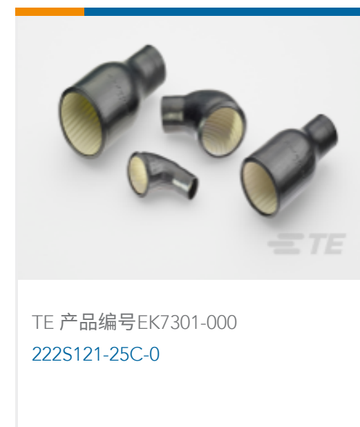
TE 产品编号EK7301-000 222S121-25C-0