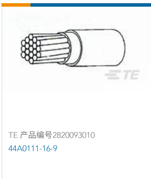
TE 产品编号2820093010 44A0111-16-9