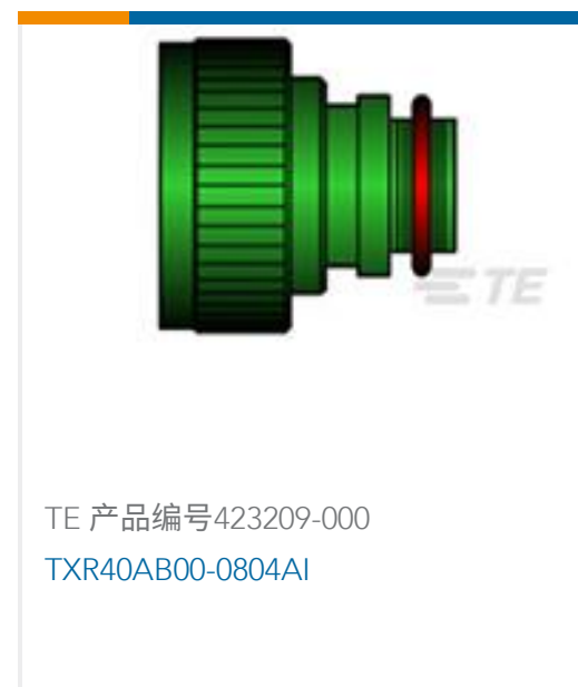
TE 产品编号423209-000 TXR40AB00-0804AI