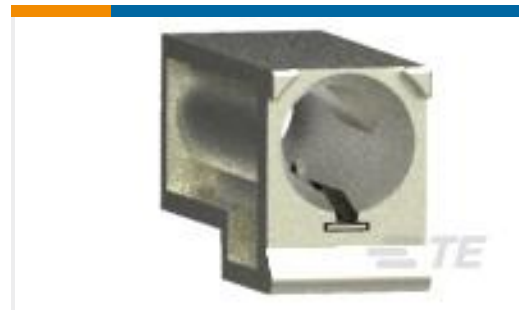
TE 产品编号1-1469492-8 MULTIGIG RT 9MM GUIDE/ESD 315 DEG