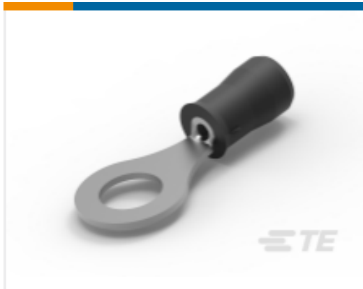
TE 产品编号35112 PIDG Ring Tongue Terminals