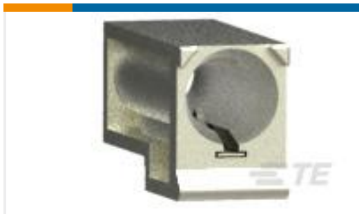
TE 产品编号1-1469492-1 MULTIGIG RT 9MM GUIDE/ESD 0 DEG