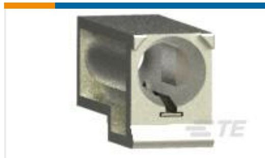
TE 产品编号1-1469492-7 MULTIGIG RT 9MM GUIDE/ESD 270 DEG