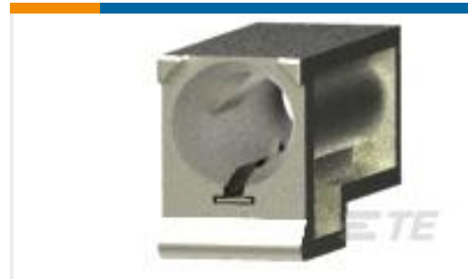
TE 产品编号1-1469492-2 MULTIGIG RT 9MM GUIDE/ESD 45 DEG