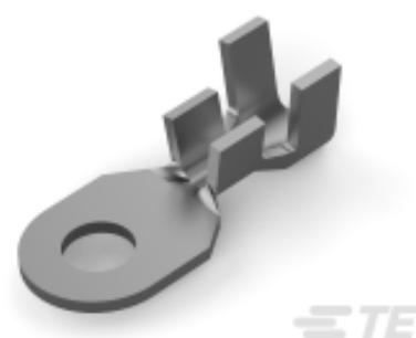
TE 产品编号 42639-1 RING TERMINAL 14-12 AWG BR