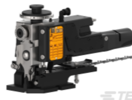
TE 产品编号 2150730-2 OCEAN_2.0_APPLICATOR-E-190F250F