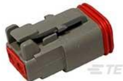
TE 产品编号DT06-2S PLG, 2P, GRY, N