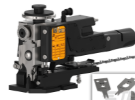
TE 产品编号 7-2150730-2 OCEAN_2.0_APPLICATOR-E-190F250F