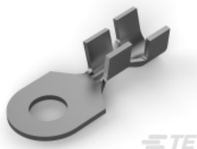
TE 产品编号 60485-1 RING TERMINAL 14-12 AWG TPBR