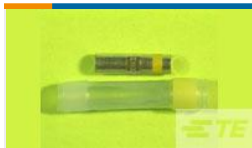
TE 产品编号 650075-000 D-436-37