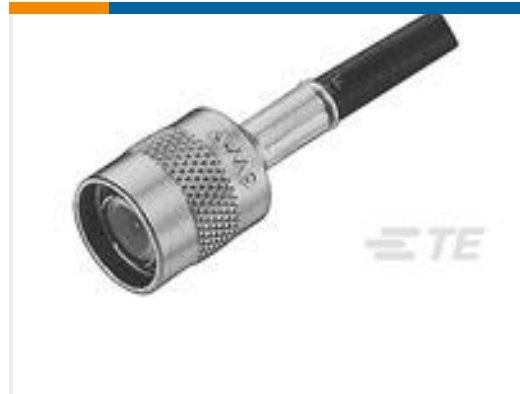
TE 产品编号225550-6 TNC PLUG DUAL W/P