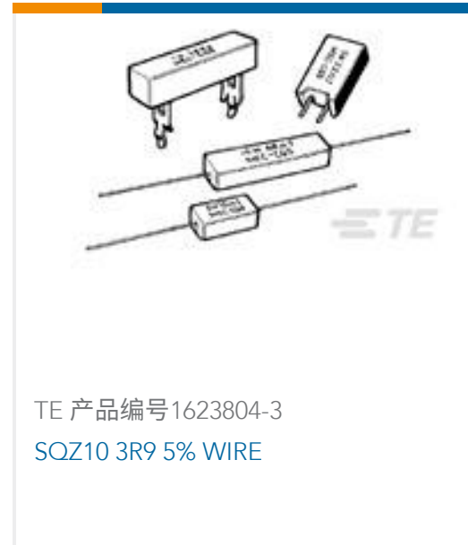
TE 产品编号1623804-3 SOZ10 3R9 5% WIRE