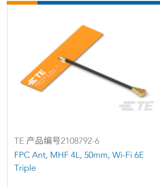
TE 产品编号2108792-6 FPC Ant, MHF 4L, 50mm, Wi-Fi 6E Triple