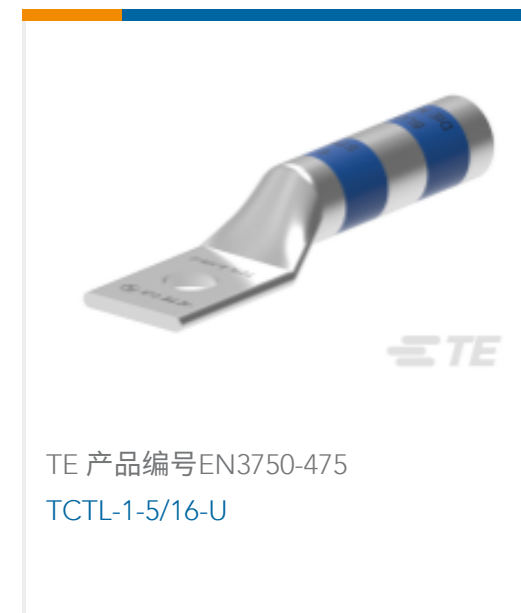
TE 产品编号EN3750-475 TCTL-1-5/16-U