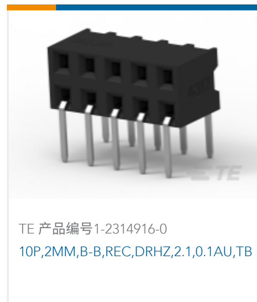
TE 产品编号1-2314916-0 10P,2MM,B-B,REC,DRHZ,2.1,0.1AU,TB