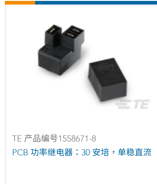
TE 产品编号1558671-8 PCB 功率继电器：30 安培，单稳直流