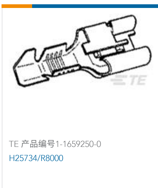
TE 产品编号1-1659250-0 H25734/R8000