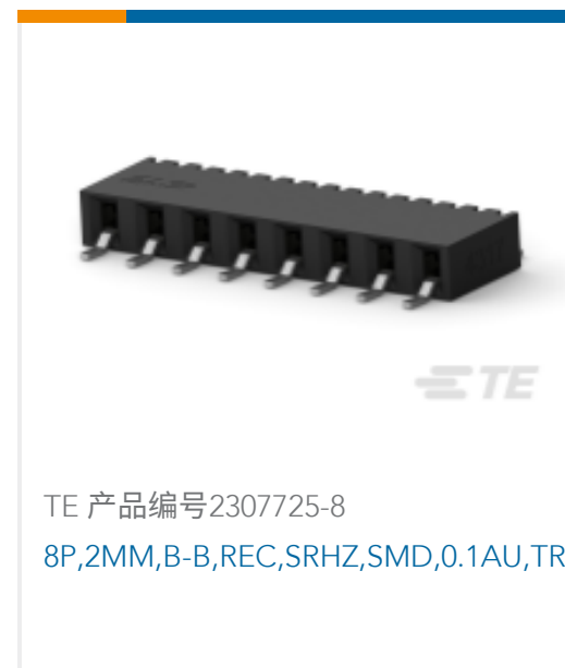
TE 产品编号2307725-8 8P,2MM,B-B,REC,SRHZ,SMD,0.1AU,TR