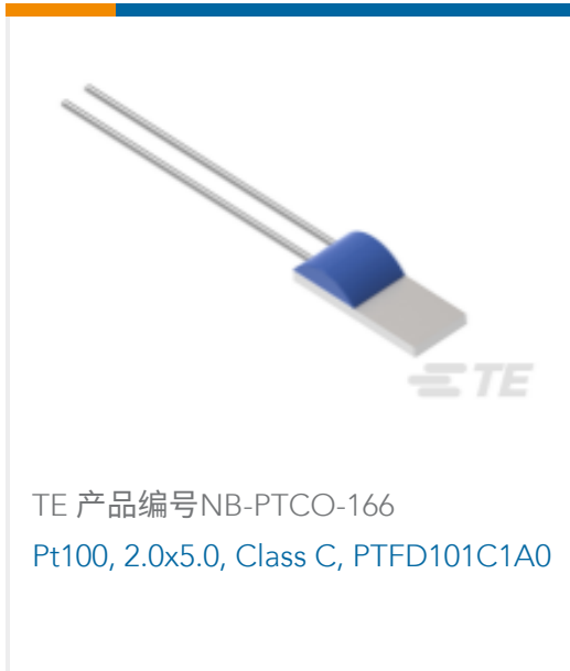
TE 产品编号NB-PTCO-166 Pt100, 2.0x5.0, Class C, PTFD101C1A0